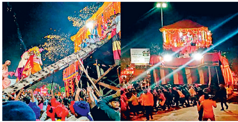
परिक्रमा से पूर्व उतारी गई नजर...

विश्वप्रसिद्ध ऐतिहासिक बस्तर दशहरा की महत्वपूर्ण रस्म फूलरथ परिक्रमा परम्परानुसार जवानों द्वारा गाई आफ आनर देकर पूरी की गई। रथ खींचने के लिए ग्रामीण क्षेत्रों से पहुंचे ग्रामीणों व शहर के श्रद्धालुओं ने भी अपना योगदान दिया। इस वर्ष छह दिन तक चलने वाली