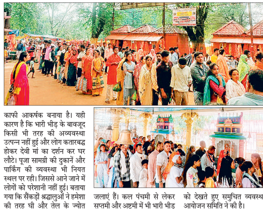
काफी आकर्षक बनाया है। यही कारण है कि भारी भीड़ के बावजूद किसी भी तरह की अव्यवस्था उत्पन्न नहीं हुई और लोग कतारबद्ध होकर देवी मां का दर्शन कर घर लौटे। पूजा सामग्री की दुकानें और पार्किंग की व्यवस्था भी नियत स्थल पर रही। जिससे आने जाने में लोगों को परेशानी नहीं हुई। बताया गया कि सैंकड़ों श्रद्धालुओं ने हमेशा की तरह घी और तेल के ज्योत

हरिभूमि न्यूज ►► जगदलपुर बकावंड ब्लॉक के गिरोला में रविवार को देवी हिंगलाजीन मां की पूजा अर्चना करने बड़ी संख्या में श्रद्धालु पहुंचे। चतुर्थी पर भारी भीड़ रही, प्रवेश द्वार से ही दो कतार में भक्त दर्शन के लिए मौजूद थे। सुचारु रूप से सभी श्रद्धालुओं को बिना किसी परेशानी के देवी दर्शन हो सके इसके लिए आयोजन समिति तथा पुलिस बल द्वारा समुचित व्यवस्था की गई थी। घंटों इंतजार के बाद लोग मंदिर में देवी दर्शन कर निहाल हो रहे थे। बस्तर विधायक लखेश्वर बघेल इस मंदिर के पुजारी हैं उनके पिता, दादा, परदादा सालों से इस मंदिर की व्यवस्था संभालकर विधि विधान से पूजा अर्चना करते रहे हैं। मंदिर को भव्य रूप देने के लिए विधायक ने ओडिशा के कारिगरों और शिल्पियों को बुलाकर मंदिर को